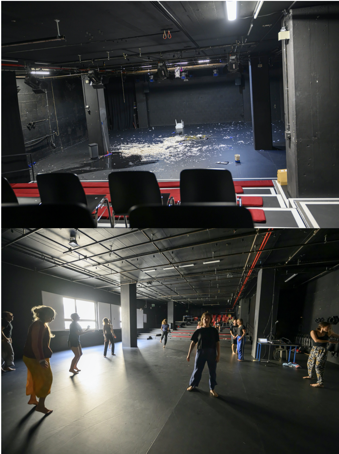
(résidence collective INCUBO & KarteNoire été 2023)